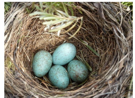
Amselnest Eier

https://www.vogelwarte.ch/de/ratgeber/schnitt-von-straeuchern-und-hecken-in-siedlungen-wann-und-wie/