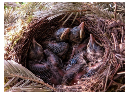
Amselnest Jungvögel