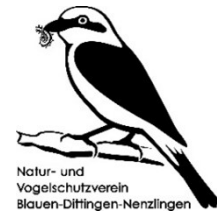
Natur- und Vogelschutzverein Blauen-Dittingen-Nenzlingen